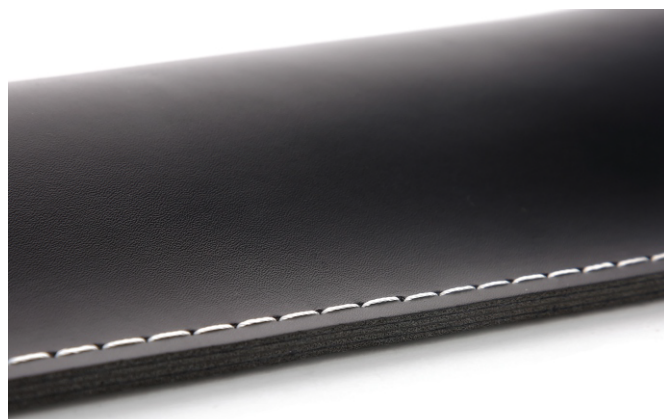
Taglio netto: cucite e taglia materiali pesanti