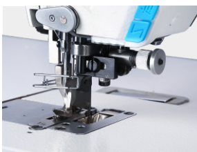
Coltello rifilatore laterale