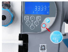
Macchina computerizzata con rasafilo fermatura e alzapiedino automatici