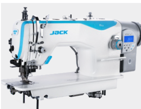
Motore Integrato e nuovo design