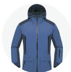
Tute da Sci