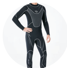
Mute da Sub