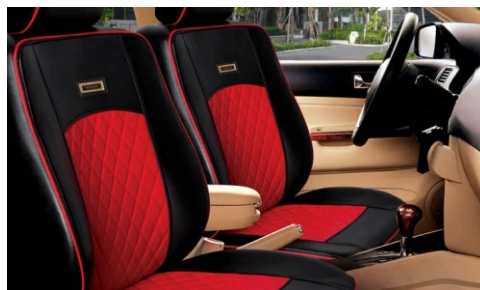
Sedili delle auto