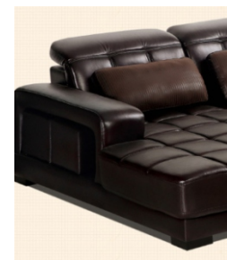
Divani in pelle