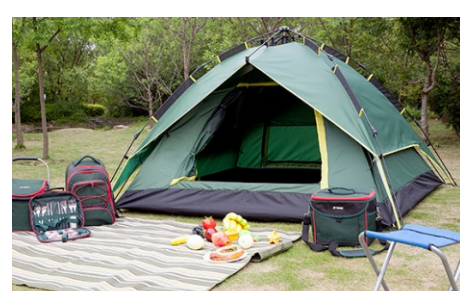
Tende da campeggio